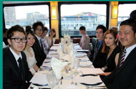
ボストンでもディナークルーズを楽しみます。正装がリリしい!

378年の歴史を持つアメリカ最初の大学で、「世界一の名門大学」として知られています。世界各国から様々な民族・人種の優秀な学生を受け入れ、卒業生はその多くが世界中の各分野でリーダーとして活躍しています。