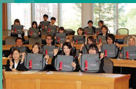
ハーバードでの閉講式を終えて。約4週間、充実の研修でした