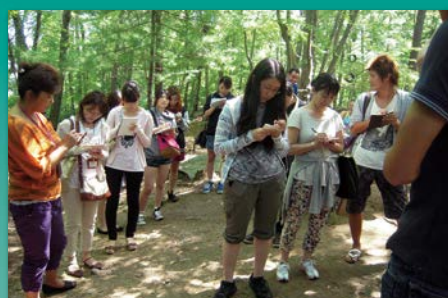
環境保護教育プログラムを提供するヘイルリザベーションサービスに参加