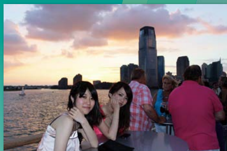
ハドソン川でディナークルーズ。マンハッタンの夕暮れと夜景はとても美しい!