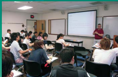
エイズについての講義。このあと、実際にHIV/AIDS感染者のための居住施設を訪れます