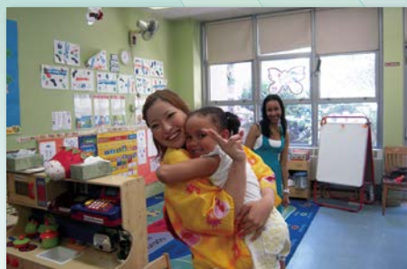
低所得世帯の子もたちが就学時に不利にならないよう教育サービスを提供するヘッドスタートプログラム

アジア圏からの留学生は日本におけるアメリカ領事館での短期ビザの審査が厳しく、個人での申請は困難。本学はアジア圏からの留学生受け入れに豊富な経験と実績をもっており、学生の夢の実現のため、本学職員がビザ申請もサポートします。