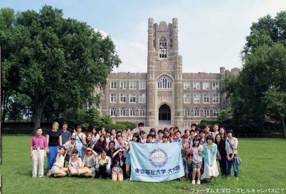
フォードダム大学ローズヒルキャンパスにて