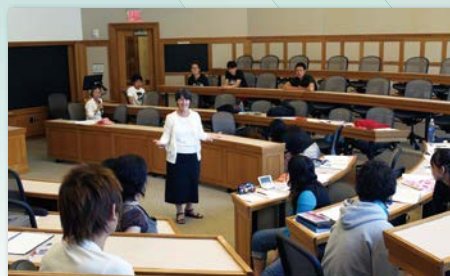
あこがれのハーバード大学法科大学院の教室で授業を受けます