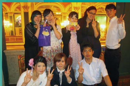
少しおしゃべりをして、ブロードウェイでミュージカルを鑑賞