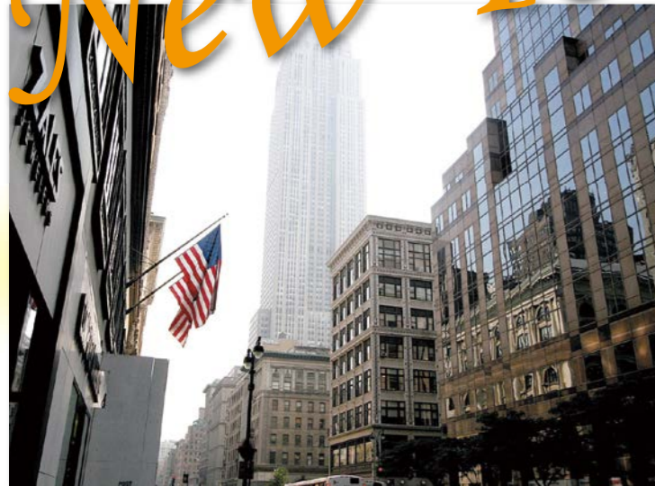
マンハッタン地区