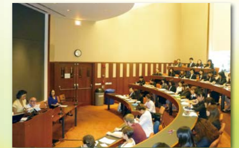
世界一の大学ハーバード大学での講義。こんな経験ができるものこの研修ならではの、すべて通訳付きなので安心です