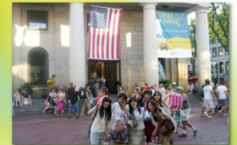
もちろん自由時間もたっぷり。ショッピングや大リーグ観戦、美術館・ミュージカル鑑賞など盛りだくさんの内容です