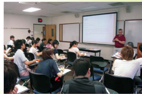
エイズについての講義。このあと、実際にHIV/AIDS感染者のための居住施設を訪れます