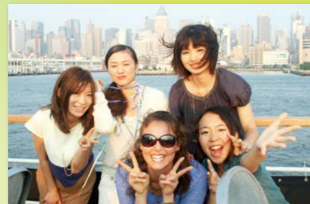
高層ビルが立ち並ぶニューヨークの夜景は圧巻!そんな夜景を高級ディナーをいただきながら楽しむ贅沢なディナークルーズ