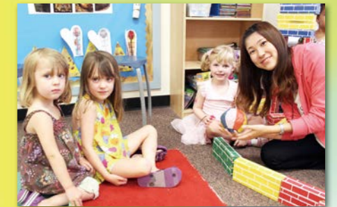
ベルモント・ナーサリー・スクールで子どもたちと交流。折り紙や紙風船など日本のあそびで楽しみました