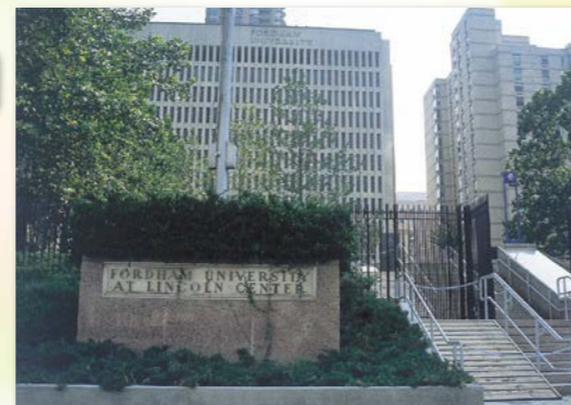
リンカーンセンター(マンハッタン)キャンパス

ニューヨーク市に174年の歴史を持つ、フランシスコ・ザビエルで有名な、上智大学と同じカトリック・イエズス会系の名門大学です。教育学大学院・法科大学院・社会福祉学大学院等のある、全米トップクラスの大学院大学です。