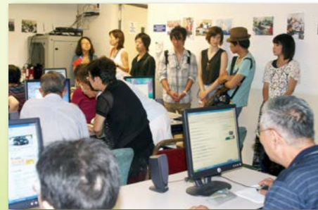
高齢者の自立を支援するセルフヘルプ・コミュニティサービス。住居や教育、ケアマネジメントなどあらゆるサービスを提供している先進の福祉施設を見学します