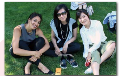
案内役にはシャベロンという日本語がわかる現地の学生たちが帯同。同年代の学生との交流も刺激になるでしょう