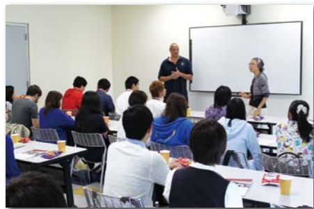
児童虐待についての講義。このあと、実際に深刻な家庭問題を抱えた児童のための居住施設を訪れます