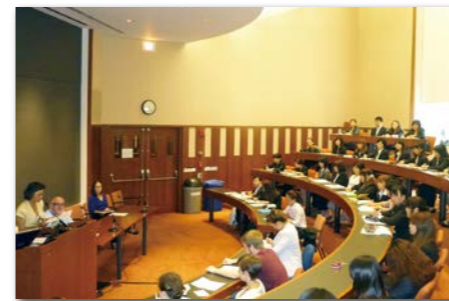
世界一の大学ハーバード大学での講義。こんな経験ができるのもこの研修ならではの、すべて通訳付きなので安心です