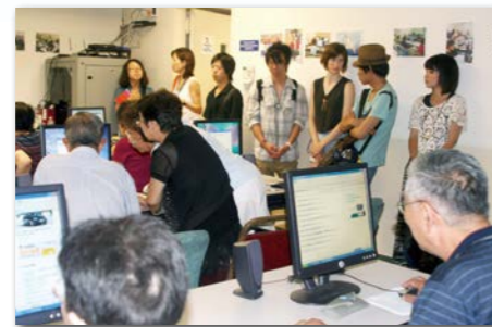
高齢者の自立を支援するセルフヘルプ・コミュニティサービス。住居や教育、ケアマネジメントなどあらゆるサービスを提供している先進の福祉施設を見学します