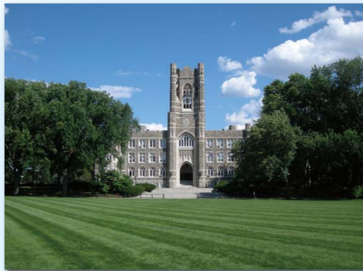
フォーダム大学ローズヒルキャンパス