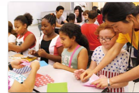
ベルmont・ナーサリー・スクールで子どもたちと交流。折り紙や紙風船など日本のあそびで楽しめました