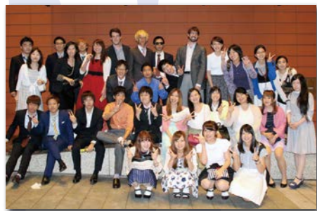
ドレスアップをしてミュージカルを鑑賞。本場の迫りに圧倒されました。ブロードウェイでは毎日たくさんのミュージカルが上演されています