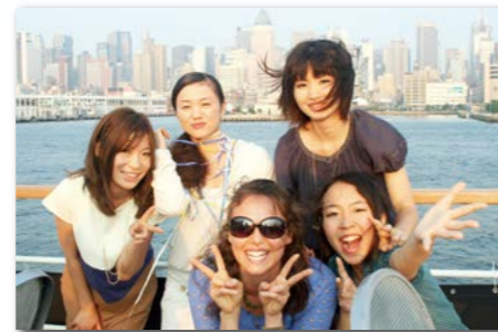
高層ビルが立ち並ぶニューヨークの夜景は圧巻！そんな夜景を高級ディナーをいただきながら楽しむ贅沢なディナークルーズ