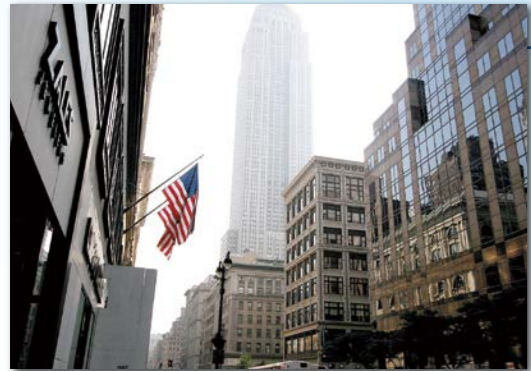
マンハッタン地区

フォーダム大学があるマンハッタン地区は、大都市ニューヨークの中心。タイムズスクエアや5番街、ウォール街などがあり、世界的な有名企業が数多く立地しています。大学や美術館、博物館も多く、経済だけでなく文化の中心地ともいえます。