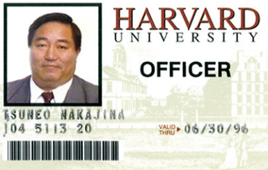
ハーバード大学招聘学者証明書

ハーバード大学教育学大学院での研究成果を自ら創立した東京福祉大学、理学・作業名古屋専門学校、保育・介護・ビジネス名古屋専門学校などの系列研究施設の日々の授業に生かし「できなかった子(生徒)をできる子(学生)にするのが教育」の建学の理念で、医療・福祉・心理・教育等のしっかりした知識と技術を身につけ優秀な学生や教員の人材育成に力を注ぐ。