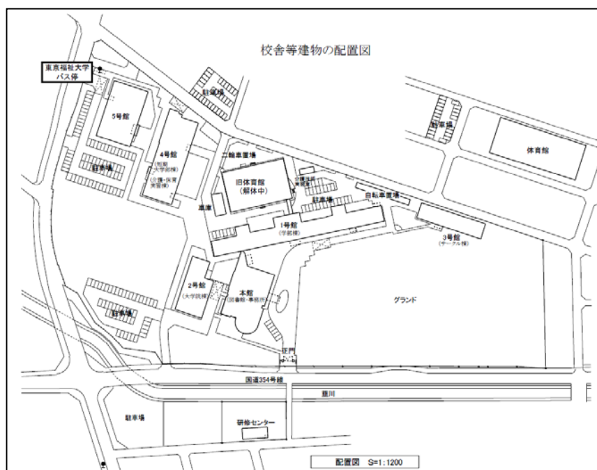
図Ⅲ-B-①：キャンパス概要図

校地面積は59,240㎡で、併設する東京福祉大学と共用であるが、短期大学設置基準に定める面積を充足している。その形態及び校舎の配置は(図Ⅲ-B-①：キャンパス概要図)に示す通りである。